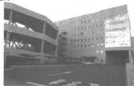
小山企業・埼玉総合物流センター